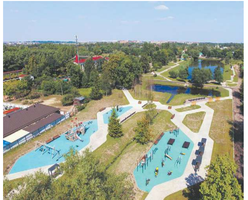
Александровская с высоты птичьего полета

Уважаемые водители! Госавтоинспекция Пушкинского района призывает вас предоставлять преимущество в движении пешеходу на нерегулируемых пешеходных переходах. Соблюдайте скоростной режим и дистанцию перед движущимся транспортным средством!